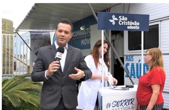
A campanha foi reportagem na Zona Leste TV

Além do atendimento especializado e aparelhos modernos, a equipe comercial também participou da ação, onde divulgaram o Plano Odonto oferecido pelo São Cristóvão Saúde, através de folders e brindes personalizados da campanha.