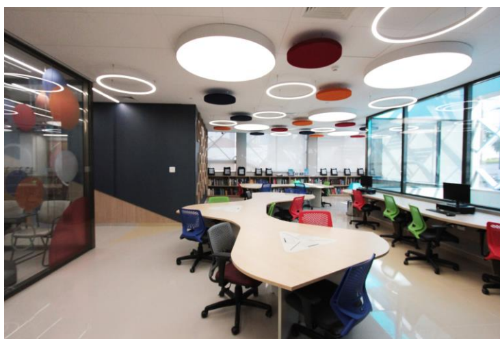
Parte da sede administrativa do Grupo nas dependências do IEP

Visando promover mais conforto aos beneficiários, colaboradores e comunidade em geral, o Grupo São Cristóvão Saúde realizou, no dia 05 de maio, mais uma importante inauguração: o Instituto de Ensino e Pesquisa Maria Patrocínia Pereira Ventura - IEP Dona Cica. Localizado na