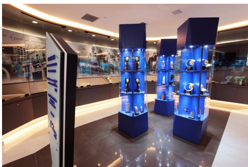
Memorial São Cristóvão conta com acervo físico, digital e interativo, além de mesa touch, totem e videowall

O terceiro andar do IEP abriga o corpo diretivo do Grupo. A sala da presidência e de reuniões são integradas e automatizadas, com controle de iluminação, persianas, áudio e vídeo, incluindo sensor de presença. O espaço também usufrui de três conjuntos de videowall controlados via tablet para monitoramento e gerenciamento de toda a Instituição, em real time . Já a cobertura do edifício Dona Cica traz um espaço de convivência amplo e exclusivo, no qual é possível acolher os convidados e realizar eventos específicos.