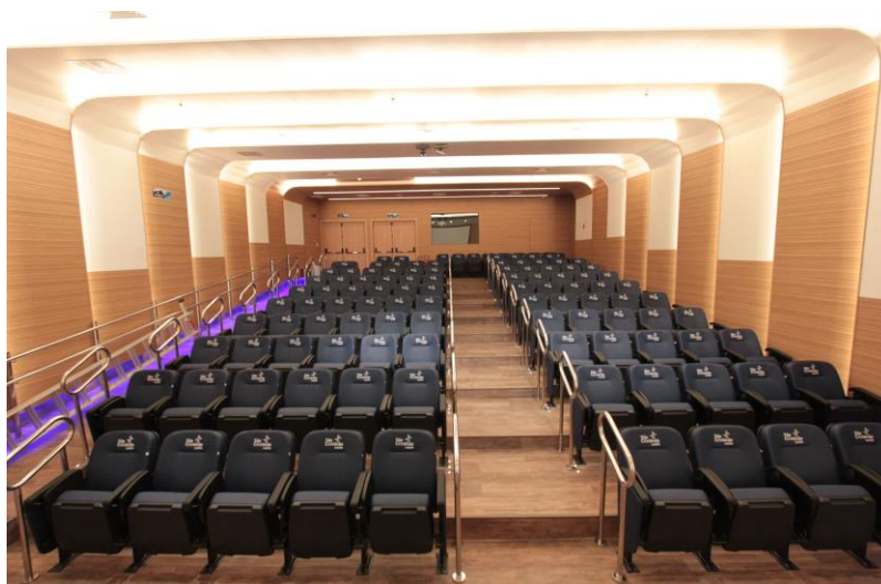
Auditório com 120 lugares, traz técnicas de acústica e luminotécnica exclusivas

O subsolo do edifício contempla parte da sede administrativa do Grupo, composto pelas áreas de Central de Regulação, Contas Médicas, Credenciamento e CCIH – Comissão de Controle de Infecção Hospitalar. Já o pavimento térreo comporta a recepção social, balcões com desenho contemporâneo - por