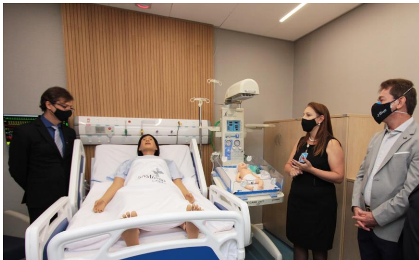
IEP possui manequins de alta fidelidade para realizar todos os tipos de simulações clínicas e comportamentais

Assim como em outros projetos realizados pelo São Cristóvão Saúde, a questão da sustentabilidade também está presente no IEP, através do sistema de captação de água pluvial, no qual a água coletada é armazenada em um reservatório de 50 mil litros, passando pelo processo de cloração e análise