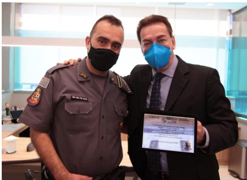
Ventura segura a placa de agradecimento feita pelo 21º Batalhão da PM ao Grupo São Cristóvão Saúde

Essa ação ocorreu no mês de abril, tendo o envolvimento de múltiplos setores Institucionais para a realização da campanha, cujas doses foram cedidas pelo governo de São Paulo. Dentre os insumos doados pelo São Cristóvão Saúde estão caixas descarpack,