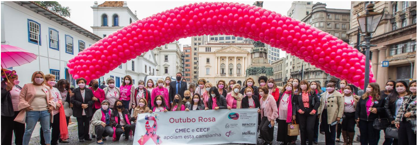
Participantes do evento realizado pelo CMEC da Associação Comercial de São Paulo

atual #OCâncerNãoespera e da palestra realizada sobre o tema para as participantes. Na oportunidade, também foram distribuídos material instrutivo e uma caneta personalizada.