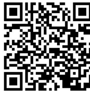
QR Code do whatsapp oficial do Grupo São Cristóvão Saúde

O número oficial do Whatsapp São Cristóvão Saúde é 11 2029-7300, ou através do QR CODE (ao lado).