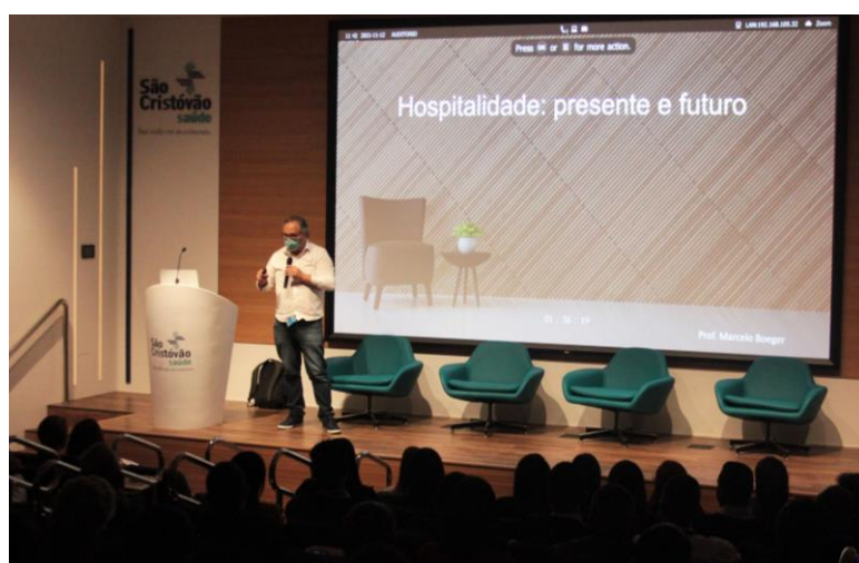
Colaboradores assistem a palestra sobre Hospitalidade

No evento, destinado a todas as áreas que envolvem a Hotelaria Hospitalar do São Cristóvão Saúde, os colaboradores puderam prestigiar importantes