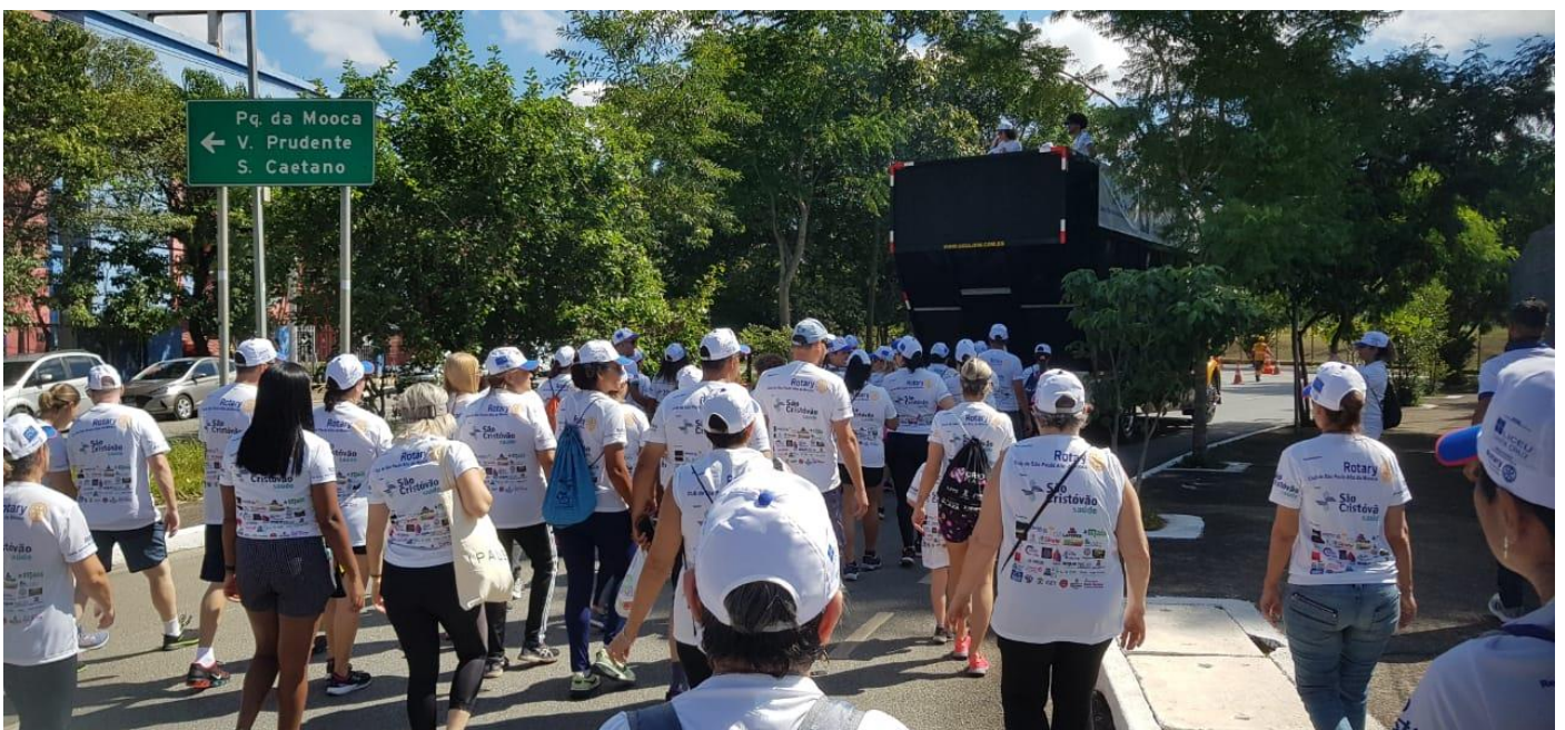
Centenas de pessoas participaram do evento em 2023

A Instituição também disponibilizou uma ambulância para retaguarda e contou com o time das áreas Comercial do Plano de Saúde e Hospital, por meio da divulgação da marca e serviços oferecidos pelo Grupo.