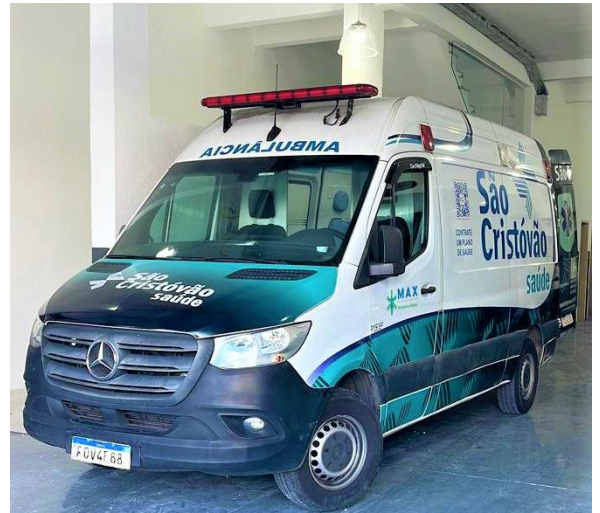
Cessão de ambulância São Cristóvão Saúde para o evento

Saúde apoiou e participou ativamente com itens de logística e estruturação, incluindo 500 camisetas com a logomarca do Grupo, além da presença de profissionais do Centro de Atenção Integral à Saúde (CAIS), que realizaram 337 atendimentos, oferecendo, gratuitamente, aferição de pressão arterial e teste de glicemia.