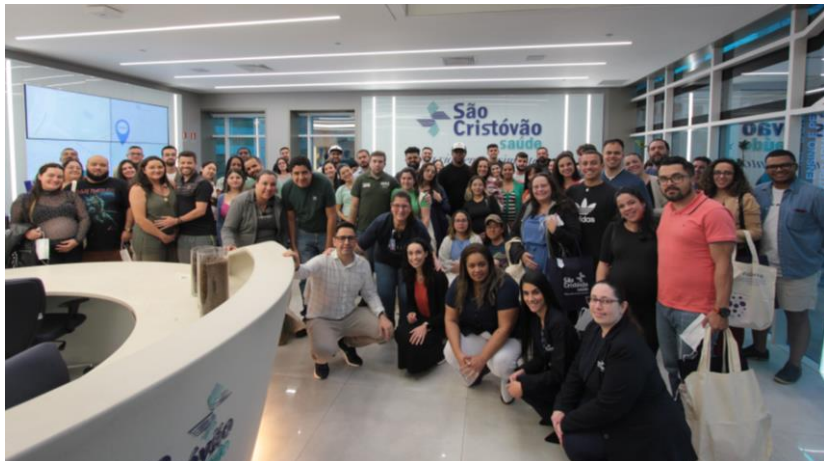
Turma do Curso Preparatório para Gestantes e Pais de 2023