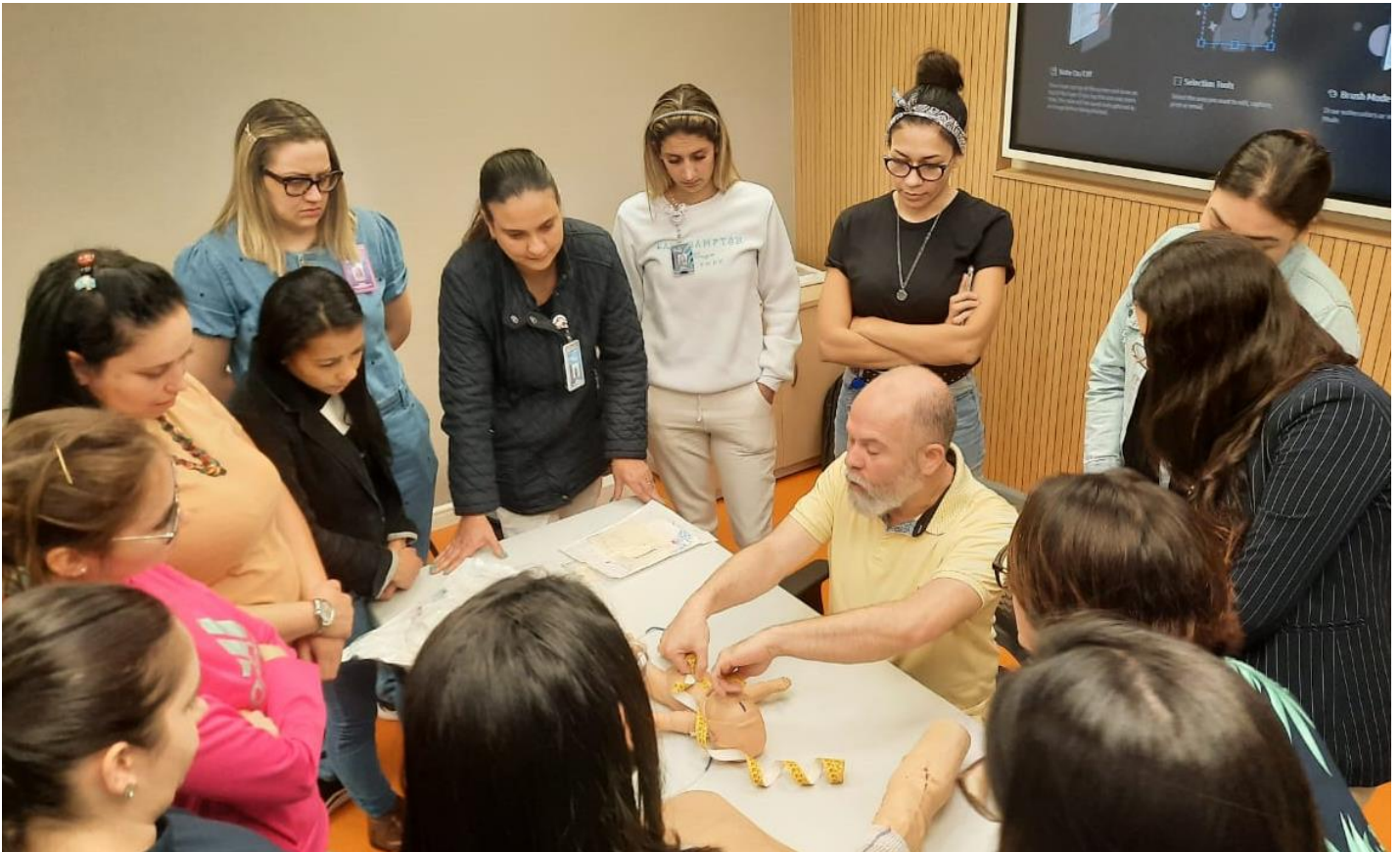
Demonstração técnica de passagem durante o curso de inserção do PICC

No dia 05 de agosto, o Grupo São Cristóvão Saúde realizou um curso no Instituto de Ensino e Pesquisa Maria Patrocínia Pereira Ventura - IEP Dona Cica, em parceria com o Grupo AMA, habilitando 26 enfermeiros para a passagem do PICC/ CCPI - Cateter Central de Inserção Periférica.