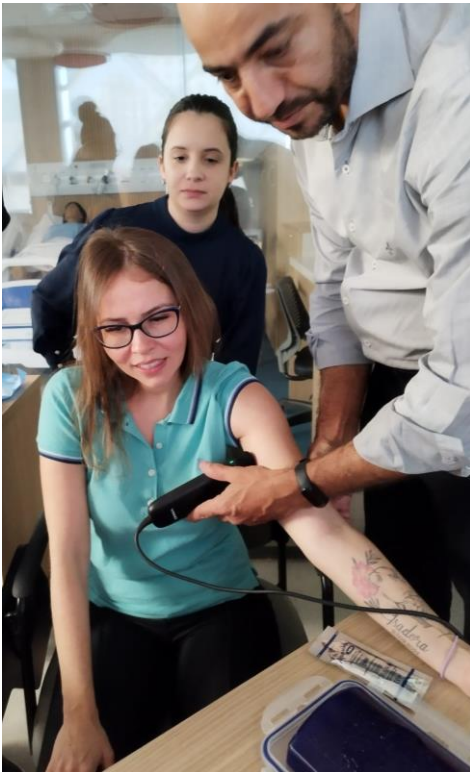
Treinamento prático com o uso do ultrassom