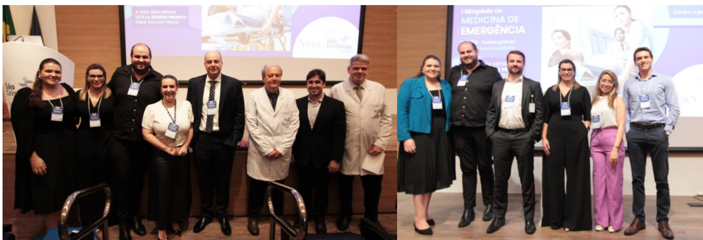
Profissionais da saúde durante o Simpósio