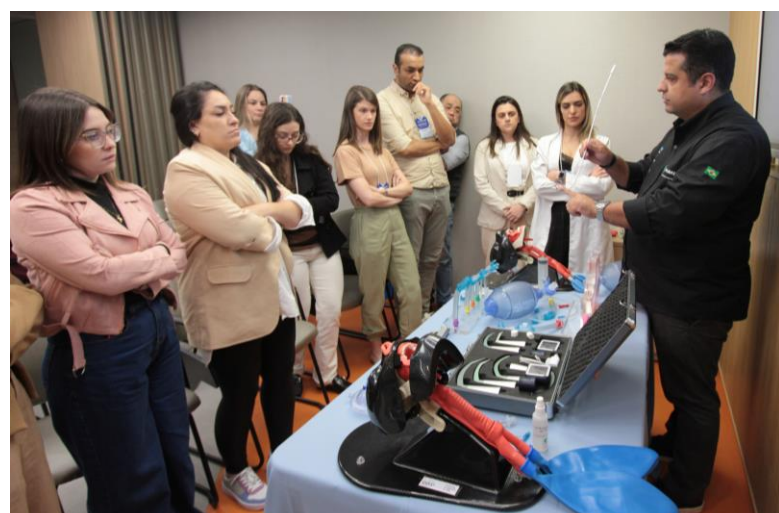
Participantes na aula de “Via Aérea Difícil”