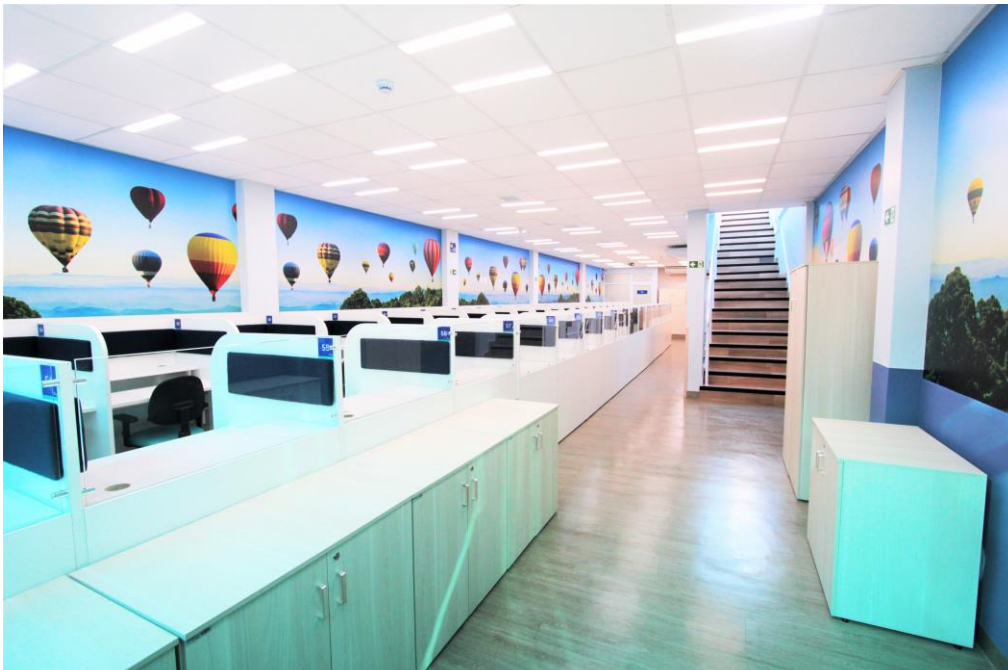
Central Fone possui 77 posições de atendimento

Para aprimorar o atendimento direcionado aos clientes e beneficiários do Plano de Saúde São Cristóvão, a Central Fone passa a ter um espaço exclusivo,