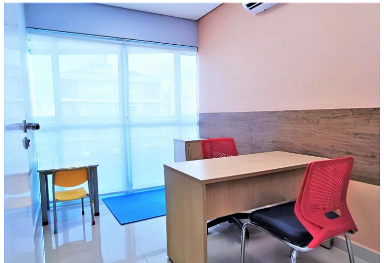
9º andar conta com 10 consultórios

O complexo hospitalar agora conta com mais duas novas acomodações, podendo ser apartamento e enfermaria, além de aumentar para mais 04 o número de leitos de internações, totalizando 321. Os ambientes são amplos, com luz de