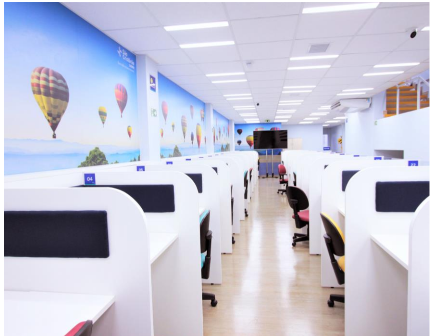
O novo prédio aumentou em 35% a capacidade de atendimento

projetado, especialmente, para acatar a demanda. Situado na Rua do Oratório, nº 1937 (Mooca), o local possui mais de 315 m 2 de área, incluindo 77 posições de atendimento, aumentando a capacidade em 35%, além de refeitório, 4 banheiros, copa, refeitório, iluminação em led, ambiente climatizado, água de reuso, mobiliário específico, acústica e detalhes lúdicos que promovem um local mais leve, descontraído e aconchegante.