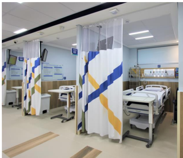
UAR dispõe de 13 leitos

projetado para oferecer conforto, segurança e eficiência assistencial, contando com infraestrutura moderna, iluminação natural, climatização adequada, acessibilidade, tecnologia integrada, sistema de distribuição de água para tratamento de hemodiálise, tubo pneumático