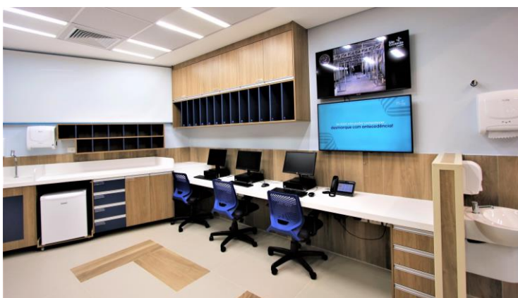
Unidade de Apoio Respiratório conta com amplo Posto de Enfermagem

No CAAV VII, por meio do São Cristóvão Medicina Diagnóstica, a ampliação dos serviços de imagem inclui a aquisição de um novo tomógrafo, equipamento essencial para a identificação precoce de