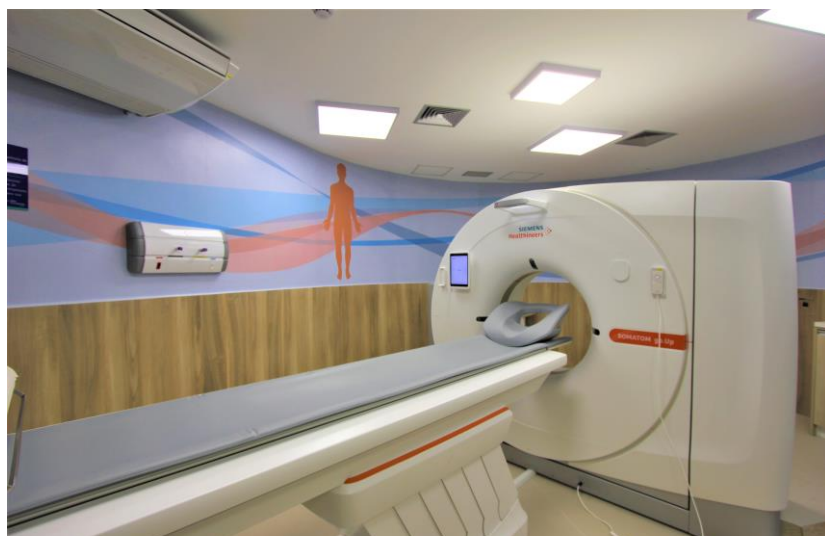
Tomógrafo do CAAV VII possui tecnologia de ponta

patologias, diagnósticos precisos e melhor condução clínica. Para isso, foi preparada uma área com blindagem radiológica, instalações elétricas específicas, portas blindadas, sinalização de segurança, controle de