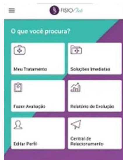
Interface do app Fisioclub

Na sala ' Fisio Digital ', o paciente é recebido em um ambiente acolhedor com uma apresentação detalhada